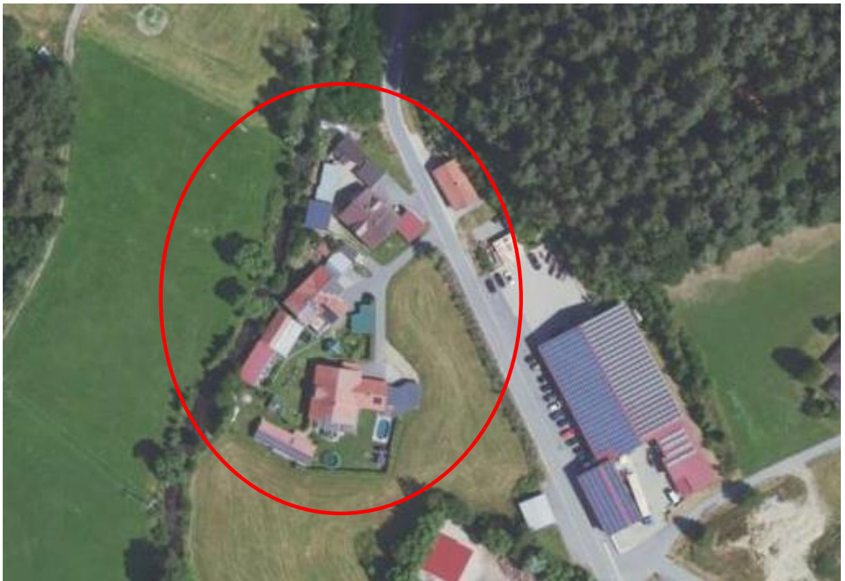
Abbildung 1 Luftbild ohne Maßstab Gemeinde Neuschönau

Der bebaute Außenbereich soll im Geltungsbereich im östlichen Bereich zunächst um eine Baufläche für ein TinyHouse innerhalb der Flurnummer 541 der Gemarkung Neuschönau ergänzt werden. Die geplante Lage ist im zeichnerischen Planteil als geplanter Standort dargestellt.